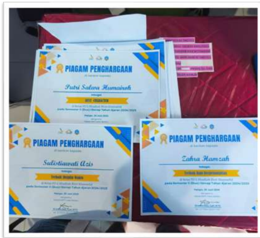
(Gambar 4.1. Piagam Penghargaan Siswa SMP IT Insan Madani Palopo pada Semester Genap Tahun Ajaran 2024/2025)

kesadaran bahwa perilaku tersebut tidak sesuai dengan nilai sekolah. Strategi semacam ini memperlihatkan keseimbangan antara pengawasan dan edukasi dalam komunikasi kelas.