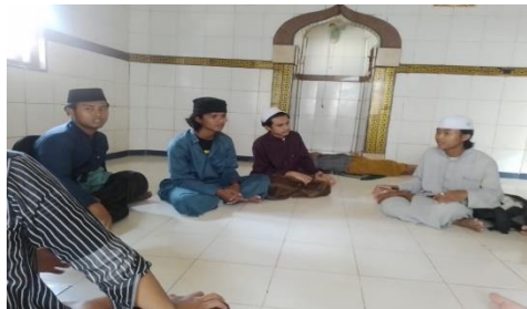
Gambar 4.1 Musyawarah remaja Jamaah Tabligh

lingkungan sosial serta terbangunnya rasa kebersamaan dalam komunitas Jamaah Tabligh.