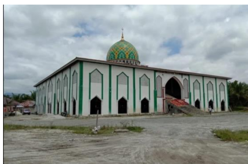
Gambar 4.2 Masjid Al-Istiqomah Radda

Hal ini sejalan dengan hasil observasi awal yang dilakukan peneliti, di mana terlihat bahwa remaja yang telah bergabung dalam Jamaah Tabligh turut serta menghadiri kegiatan musyawarah yang dilaksanakan di Masjid Al-Markas. Dalam kegiatan tersebut, para remaja berangkat bersama dan didampingi oleh anggota Jamaah Tabligh yang lebih dewasa atau yang telah lama bergabung dalam jamaah. Pendampingan ini menunjukkan adanya proses pembinaan dan penguatan nilai secara langsung, sekaligus menjadi sarana sosialisasi internal bagi remaja dalam memahami tata cara serta budaya organisasi keagamaan tersebut.